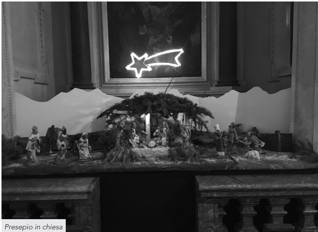
Presepio in chiesa