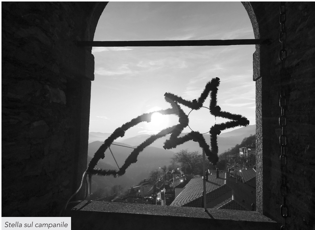
Stella sul campanile